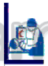
گروه نجات و امداد