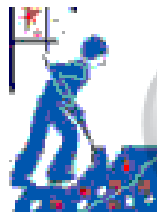
گروه جست و جو